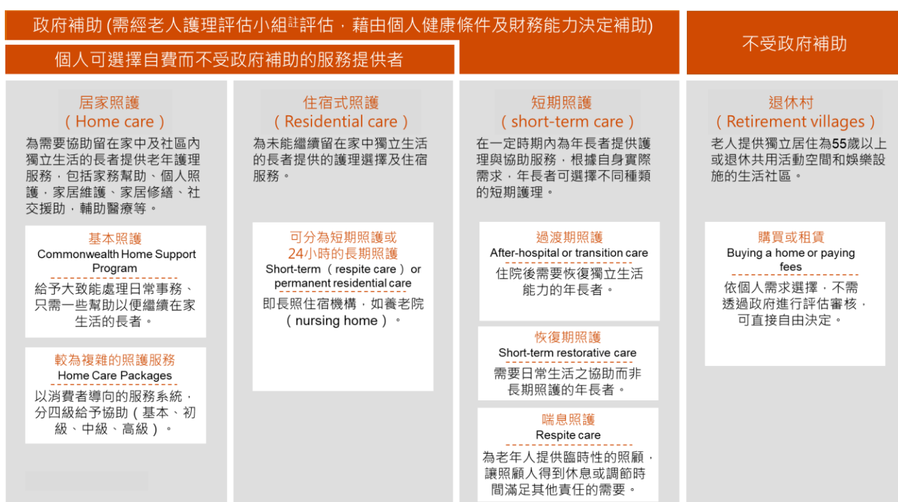
圖二、澳洲長照體系整理

註：老人護理評估小組：ACAT ( Aged Care Assessment Team )