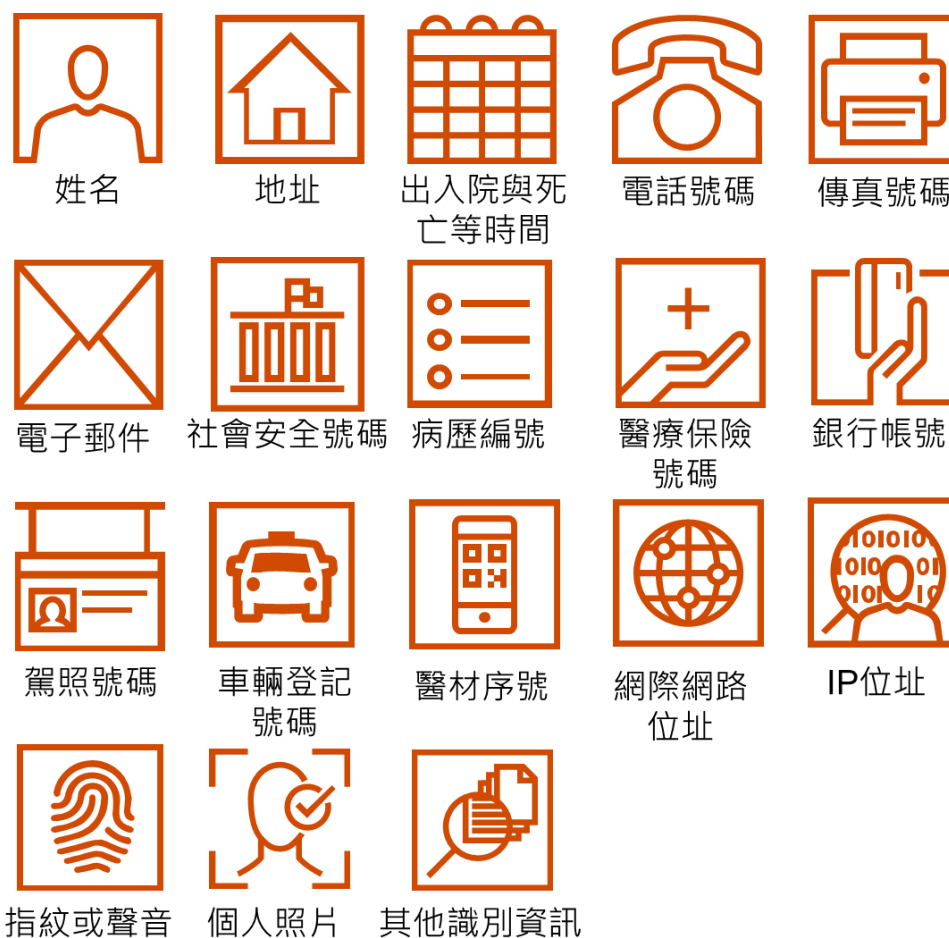
圖二、美國 HIPAA 所保護的個人識別資料(Identifiers)

理狀態，提供給該個人的醫療服務，以及該個人過去、現在及未來所支付的醫療費用。HIPAA 要求受管轄機構將任何個人健康資料的揭露與利用降到最低。而 HIPAA 由隸屬於美國衛生及公共服務部下的民權辦公室負責執行，受管轄機構若有違反 HIPAA 的情形，民權辦公室得依規定處以民事罰款，若違反行為依規定應處以刑事罰金時，則由美國司法部負責執行之。